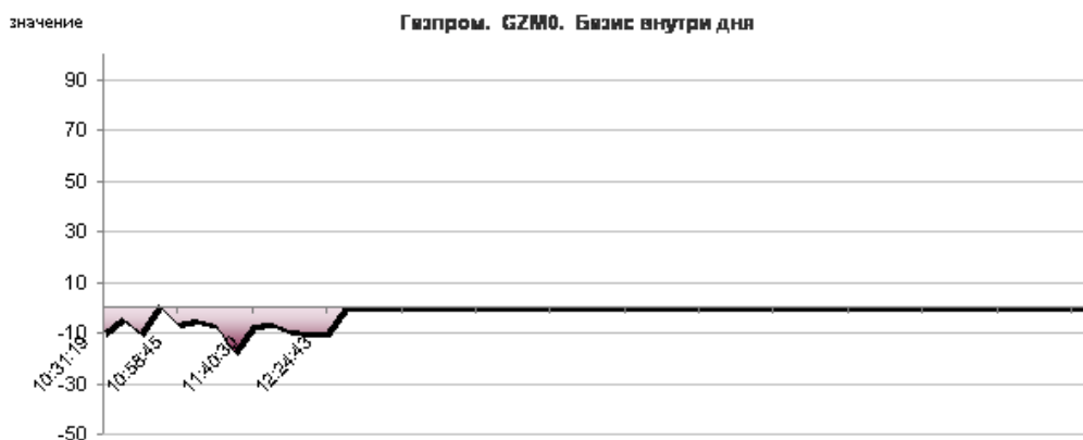
Рис. 1. История базиса (внутри дня).

В долгосрочном плане рынок остается в нисходящем тренде. На текущем рынке наблюдается «ухмылка волатильности», которая указывает на скорое возобновление нисходящего движения (рис. 2).